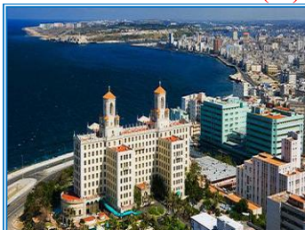
NACIONAL DE CUBA (5*)