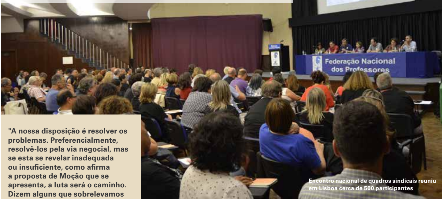
Encontro nacional de quadros sindicais reuniu em Lisboa cerca de 500 participantes

Por justiça e respeito pelos professores; por uma Escola Pública de qualidade; por um efetivo investimento na Educação A luta é o caminho!