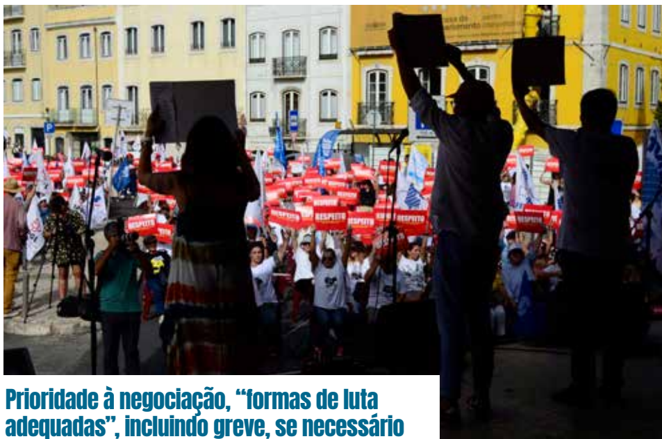
Prioridade à negociação, “formas de luta adequadas”, incluindo greve, se necessário