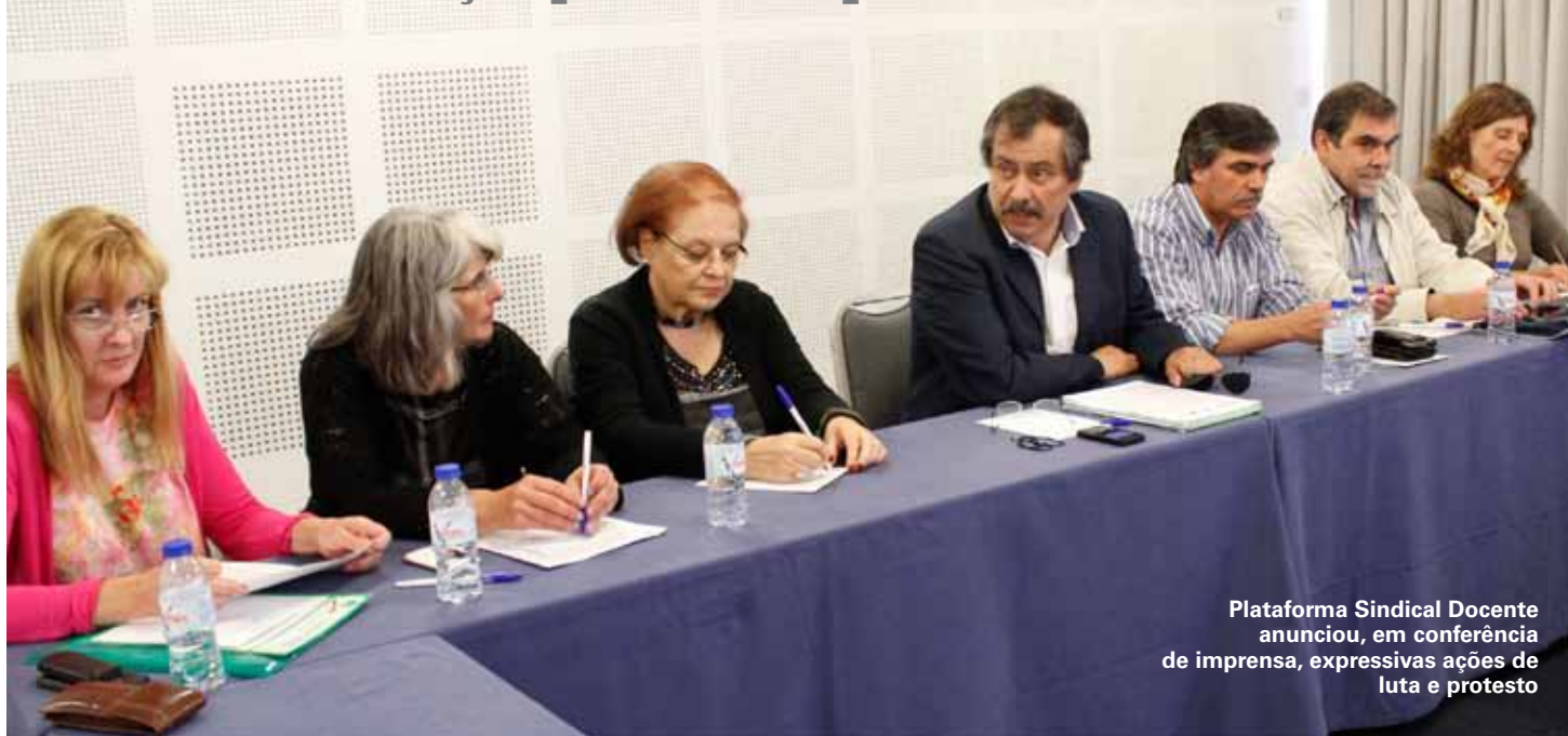
Plataforma Sindical Docente anunciou, em conferência de imprensa, expressivas ações de luta e protesto

Manifestação nacional em defesa da profissão e de uma educação pública de qualidade